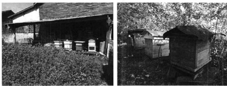
Photo 1 : Ruches installées à la Ville-aux-bois (à gauche) et à la Chaise (à droite).

La localisation des ruches est présentée ci-après (figure 1).